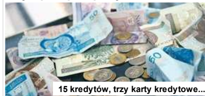
15 kredytów, trzy karty kredytowe...