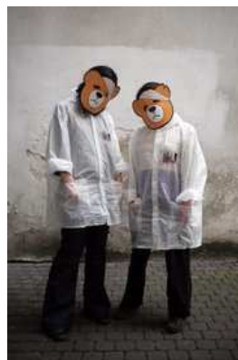
Smutne misie

Kiedy kupujemy prezent dla dziecka, niewielu z nas zastanawia się, czy towary pochodzą od producentów szanujących prawa człowieka i pracownika. Ale jest okazja, żeby się nad tym zastanowić.