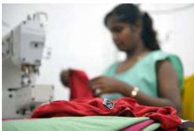
Fabryka Craft Aid, Mauritius

Moda ekologiczna - Ekologiczne ubrania i dodatki