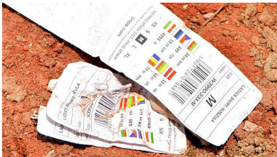
Metki firmy Cropp znalezione w gruzach fabryki w Bangladeszu